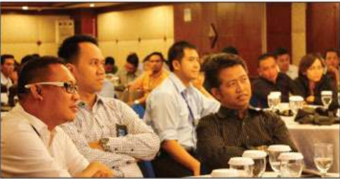
PARTISIPASI: Karyawan Angkasa Pura diberikan pemahaman antinarkoba.

dang Hukum dan Perundang-Undangan BNN Benny Jozua Mamoto. Ia menegaskan, narkoba adalah bahan atau zat yang dapat mempengaruhi kondisi kejiwaan atau psikologis seseorang. Juga dapat menimbulkan ketergantungan fisik dan psikologis. Benny mengungkap, setiap hari diperkirakan ada 50 orang mati karena narkoba. Daya rusak narkoba lebih serius dan mengerikan dibanding kasus korupsi atau terorisme. "Maka dari itu narkoba sebagai kejahatan yang luar biasa atau extra ordinary crime). Pelakunya melibatkan