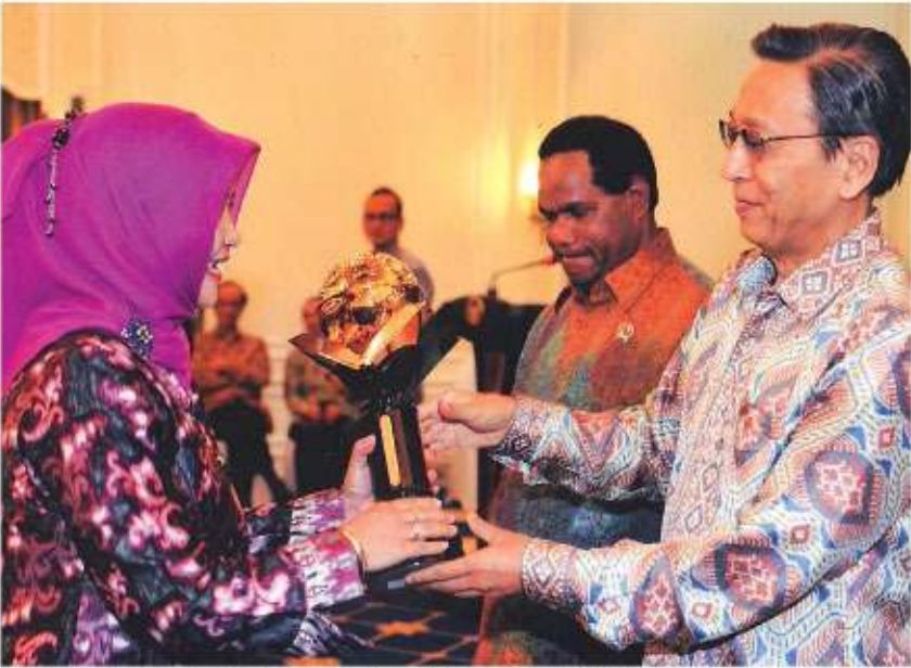
Wakil Presiden Republik Indonesia Boediono menyerahkan penghargaan Adiwiyata Mandiri kepada Kepala Sekolah SDN Sungai Bambu 05.

Usaha Bersama Membuahkan Hasil Upaya bersama ini membuahkan ha-