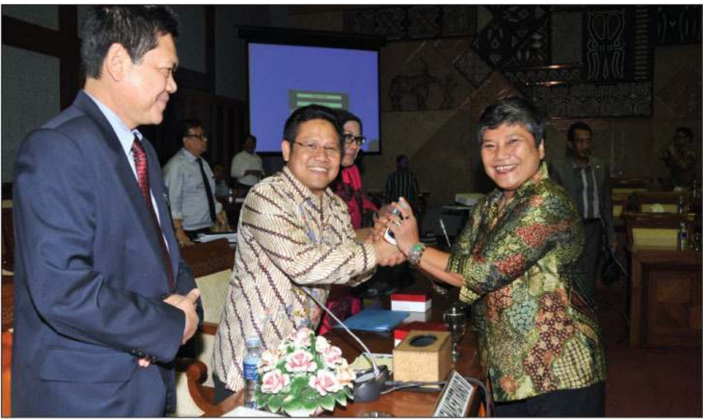
PAMIT: Menakertrans Muhaimin Iskandar (tengah) bersalaman dengan Ketua Komisi IX DPR Ribka Tjiptaning usai rapat kerja di Gedung DPR Jakarta, Rabu (24/9) malam.

JAKARTA—Jelang berakhirnya masa tugas sebagai Menteri Tenaga Kerja dan Transmigrasi (Menakertrans), Muhaimin Iskandar pamit kepada Komisi IX DPR. Pamitan tersebut disampaikan saat Muhaimin mengikuti rapat kerja dengan Komisi IX di Jakarta, Rabu (24) malam. Diduga, pamitan ini karena Muhaimin berencana mengundurkan diri sebagai menteri dan akan dilantik menjadi anggota DPR periode 2014-2019. Dalam rapat kerja yang dipimpin Ketua Komisi IX DPR, Ribka Tjiptaning, Muhaimin menyampaikan apresiasi atas hubungan baik dan kerjasama yang telah terjalin selama ini. Terutama dalam menyelesaikan berbagai permasalahan di bidang ketenagakerjaan dan ketransmigrasian. "Saya ucapkan terima kasih kepada semua para anggota, ketua, wakil ketua komisi IX atas kerja sama, kebersamaan, persahabatan, kekeluargaan selama 5 tahun ini," kata Muhaimin.