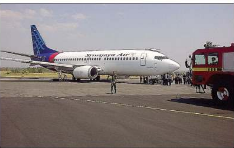
NAHAS: Pesawat sriwijaya air mengalami pecah ban saat mendarat di Bandara Hasanuddin.