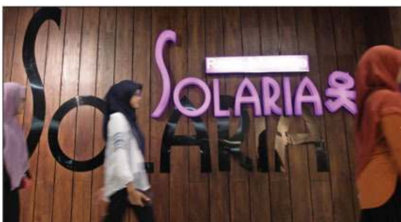
HALAL: Salah satu rumah makan yang sempat menghiasi pemberitaan karena sertifikasi halal.

Dari perspektif scientific diserahkan ke negara