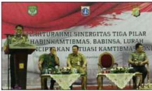
SINERGI: Peranan lurah, Babinsa dan Bhabinkamtibmas ditingkatkan.