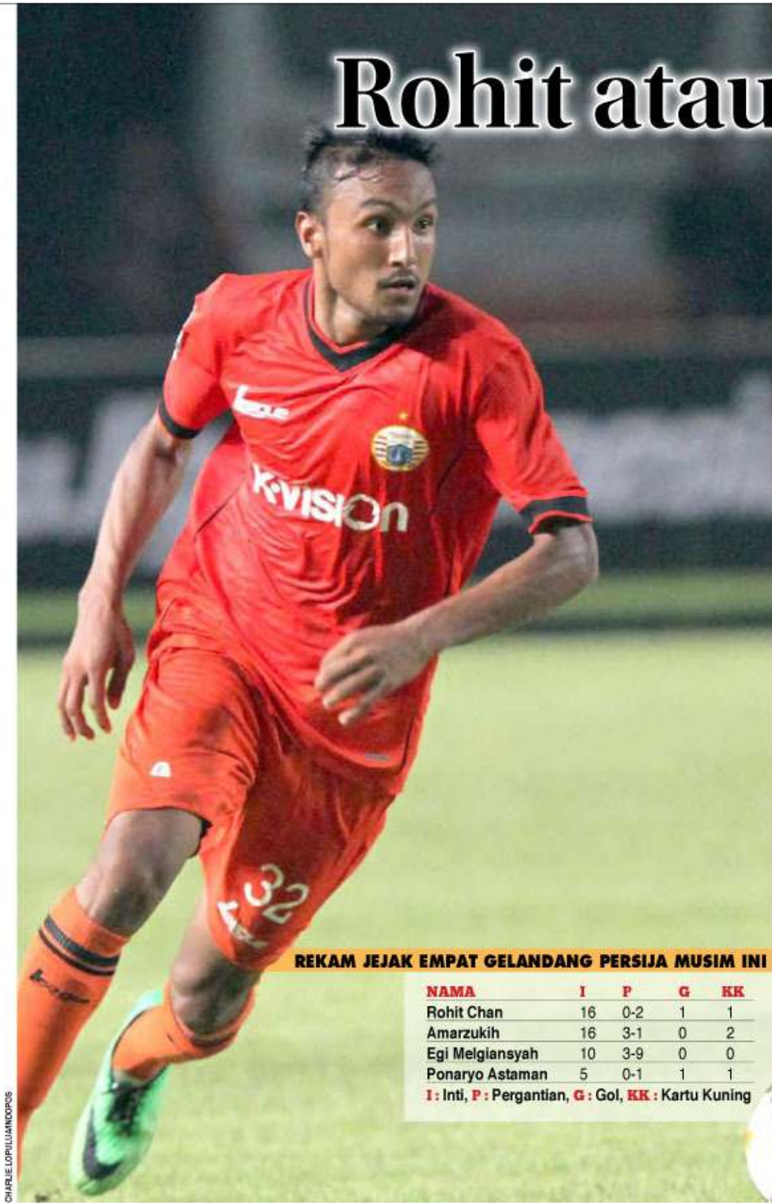
REKAM JEJAK EMPAT GELANDANG PERSIJA MUSIM INI

Asher juga menegaskan, meski telah mematok 25 persen pemain yang akan dipertahankan untuk musim depan, kewenangan mencoret pemain ada di pelatih baru Persija. "Jadi pelatih baru yang akan menentukan itu. Kan pelatih yang tahu kebutuhan tim dan siapa pemain yang tidak dibutuhkan," sambung Asher lagi. (abd)