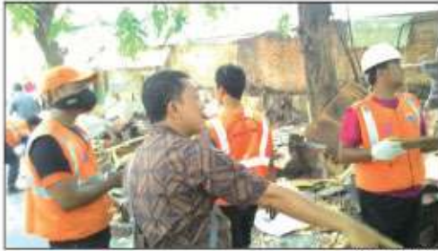
BONGKAR: Petugas saat menggusur kios liar.