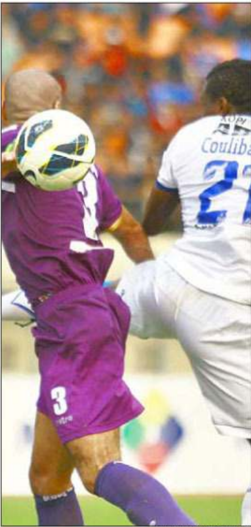
MUSAFIR: Liga Persita saat menjamu Persib di Stadion Si Jalak Harupat, Kabupaten Bandung (31/8).

"Kami terus mencoba komunikasi dengan pengurus Betman (Benteng Mania, supoter Persikota). Mereka juga berharap klub di Tangerang ini bangkit dan kembali meraih kejayaannya," pungkasnya. (sis)