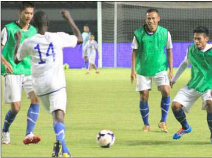
UJI COBA TERAKHIR: Para pemain Persib saat latihan di Stadion Gelora Bandung Lautan Api.

"Kami harus mengantisipasi ada pemain inti yang tak bisa dimainkan di babak delapan besar nanti. Siapa penggantinya, ya pemain yang ada saat ini," pungkasnya. (sis)