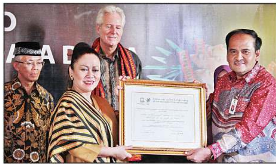
WARISAN TAK BENDA: Penyerahan sertifikat UNESCO untuk Tari Saman di TMII.