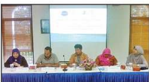
BUDAYA KEKERASAN: Para pembicara dalam seminar yang digelar di UAI.