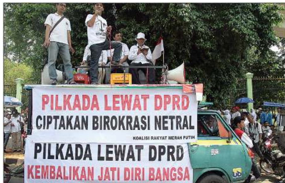
PRO PILKADA DPRD: Massa Koalisi Merah Putih (KMP) melakukan aksi demo di Depan Gedung DPR RI, Senayan, Jakarta, Kamis (25/9/2014). Mereka menuntut anggota dewan menyetujui RUU Pilkada lewat mekanisme DPRD.

Poin ketiga, menyangkut hajat hidup orang banyak dan siapa yang menjamin kepala daerah lebih baik dengan dipilih DPRD tersebut. Keempat, terkait peran perempuan kalau sampai pilkada dipilih DPRD itu ruang perempuan akan makin sempit untuk menjadi pemimpin daerah dan berkurang peranan politiknya.