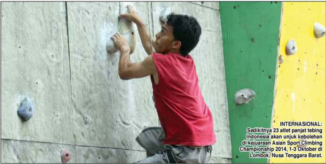
INTERNASIONAL: Sedikitnya 23 atlet panjat tebing Indonesia akan unjuk kebolehan di kejuaraan Asian Sport Climbing Championship 2014, 1-3 Oktober di Lombok, Nusa Tenggara Barat.