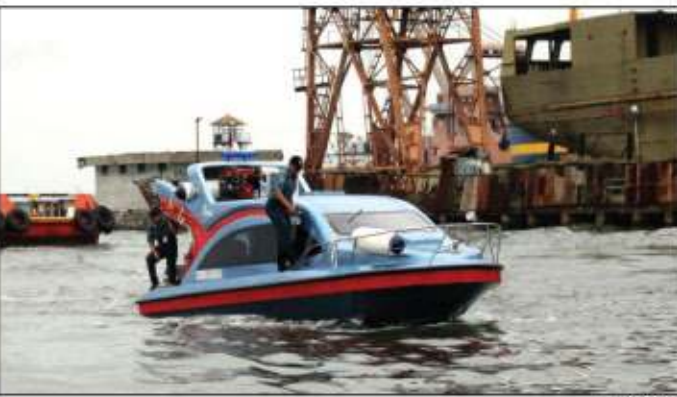
JAGA LAUT: Waspada! maraknya pencurian ikan di perairan Indonesia.

JAKARTA—Laut Indonesia menjadi surga bagi para pencuri ikan dari negara tetangga. Pengawasan yang begitu longgar, membuat kapal asing leluasa mencuri ikan di laut Indonesia menggunakan bendera Merah Putih. Karena itu pemerintah Indonesia bekerjasama dengan Amerika Serikat menguatkan komitmen untuk mengambil langkah-langkah praktis dalam memerangi kegiatan ilegal unreported and unregulated (IUU) Fishing . Hal ini diwujudkan melalui pertemuan antara Kementerian Kelautan dan Perikanan (KKP) dengan National Oceanic and Atmospheric Administration (NOAA) . Pertemuan tersebut membahas kerja sama dalam rangka penguatan kapasitas kelembagaan untuk memerantas IUU Fishing serta perencanaan tata ruang laut. Hal ini diungkapkan Menteri Kelautan dan Perikanan Sharif C. Sutardjo dalam pertemuan dengan National Oceanic and Atmospheric Administration (NOAA) di New York. Amerika Serikat, baru-baru ini. "Selama ini kemitraan strategis antara Indonesia dan AS berkembang dengan baik. Hasil nyata berupa kerjasama bilateral di berbagai sektor kelautan dan perikanan, termasuk di dalamnya untuk memerangi praktik illegal fishing ," kata Cicip, kemarin. Amerika dianggap memiliki pengalaman mumpuni dalam melindungi habitat laut dan mencegah penangkapan ikan ilegal di wilayah hukum AS. Bah-