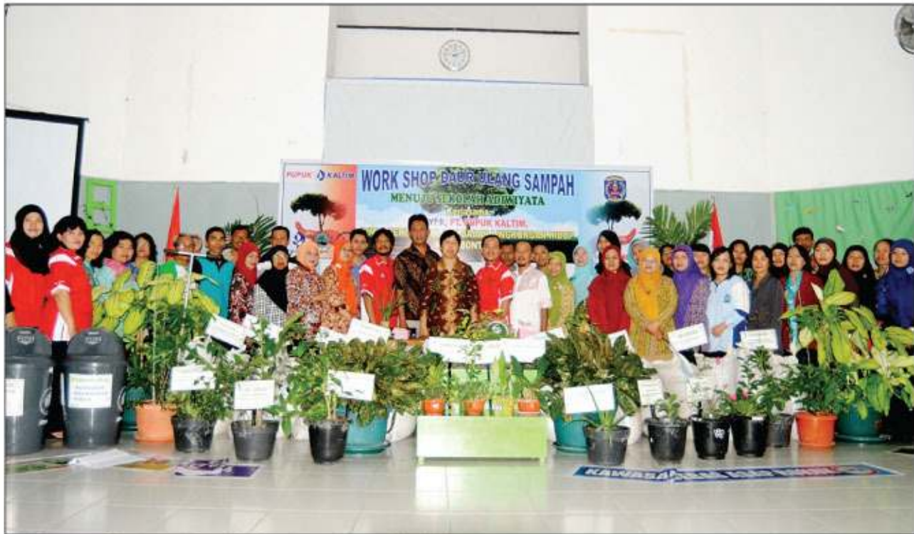
Foto Bersama Manajemen Pupuk Kaltim dengan Peserta Workshop