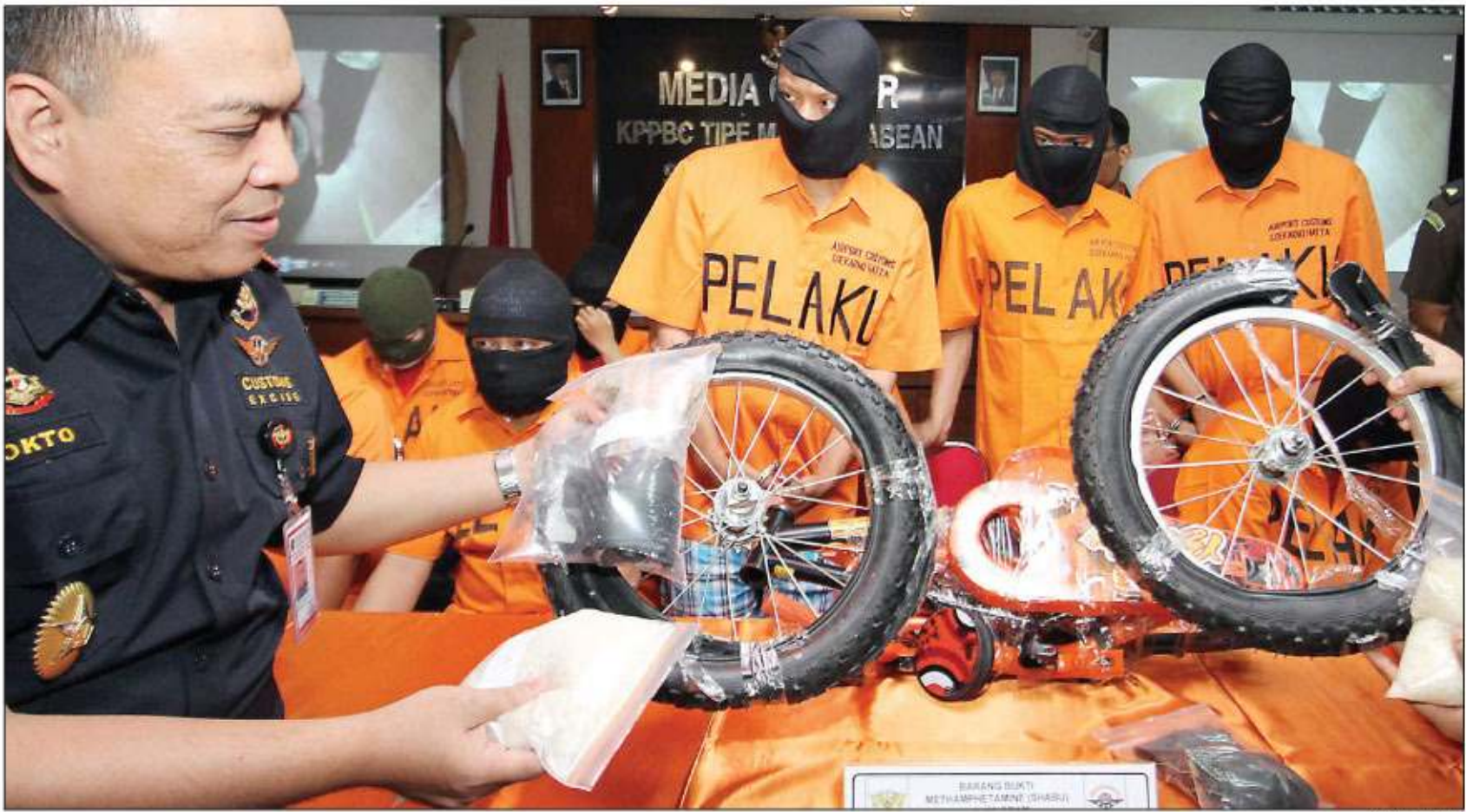
MODUS BARU: Penyelundupan sabu-sabu dalam ban sepeda anak melalui jasa pengiriman ditunjukkan dalam ekspos kasus di Kantor Bea Cukai Bandara Soekarno-Hatta, Tangerang, kemarin (25/9).