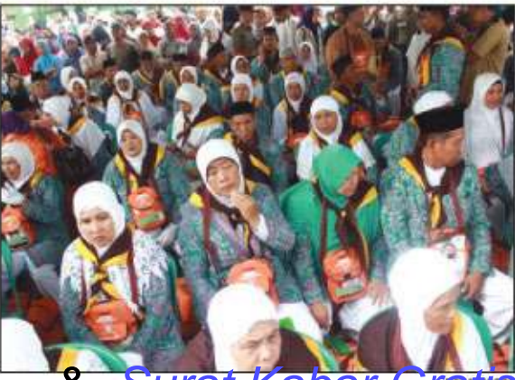
TETAP SEHAT: Calon Jamaah Haji diminta jaga kesehatan.

Mereka tersebar di Makkah sebanyak 991 orang, di Madinah 297 orang, dan di Jeddah 379 orang. Sedangkan data terakhir CJH yang meninggal ada 41 orang. Yakni di Jeddah ada dua orang, di Makkah (20 orang), dan di Madinah (19 orang). Kepada CJH yang sedang berada dalam perawatan, Lukman mendoakan agar CJH lekas sembuh. Dia berharap, saat pelaksanaan wukuf 3 Oktober nanti jamaah yang sakit, tetap bisa menjalankan salah satu rukun haji itu. "Caranya adalah dengan safari wukuf," kata Lukman kepada tim MCH, kemarin. Teknis pelaksanaan safari wukuf itu adalah, CJH yang sakit dibawa menggunakan ambulans ke lokasi wukuf. Mereka cukup berdiam di dalam mobil ambulans ketika menjalani wukuf. Karena pada intinya, wukuf itu adalah berdiam diri sambil berdoa di padang Arafah. Safari wukuf ini merupakan kegiatan rutin panitia haji Indonesia. Sebab setiap tahun selalu ada CJH yang sakit. Informasi dari tim kesehatan haji, catatan sementara bakal ada 190 CJH yang positif menjalani safari wukuf. Sebanyak 150 orang menjalani safari wukuf sambil duduk dan sisanya sebanyak 40 orang dengan tidur. CJH yang menjalani safari wukuf ini tidak terlalu lama berada di padang Arafah. Setelah selesai safari wukuf, mereka dibawa kembali ke Makkah. CJH yang menjalani safari wukuf ini tidak mengikuti wajib haji seperti bermalam di Mudzaliyah dan melontar jumrah di Mina. (wan/end)