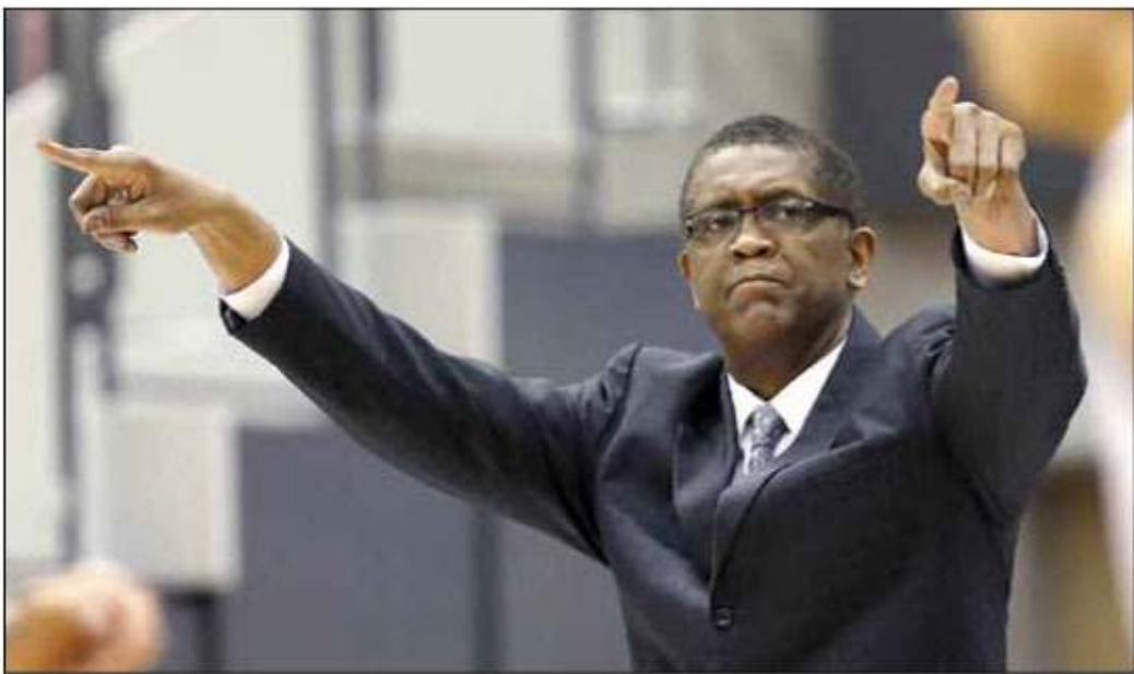
TUGAS BARU: Bill Cartwright resmi menjabat pelatih tim nasional Meksiko.