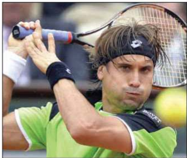
KANDAS: David Ferrer terhenti di babak dua Shenzhen Terbuka.