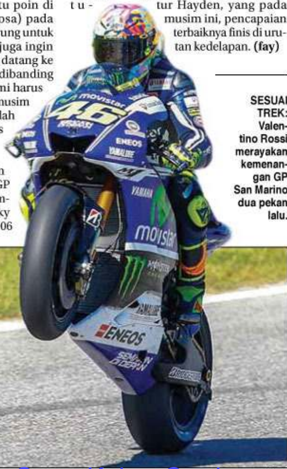
SESUAI TREK: Valentino Rossi merayakan kemenangan GP San Marino dua pekan lalu.

berkebangsaan Amerika Serikat (AS) itu akan kembali membalap setelah absen pada empat seri lantaran menjalani masa pemulihan pasca operasi pergelangan tangan kanan pada Juli lalu. "Saya sangat senang akhirnya bisa kembali beraksi akhir pekan ini. Balap motor bagi saya bukan hanya pekerjaan, tapi juga passion saya. Bukan hal mudah bagi saya untuk absen di banyak seri balap," tutur Hayden, yang pada musim ini, pencapaian terbaiknya finis di urutan kedelapan. (fay)