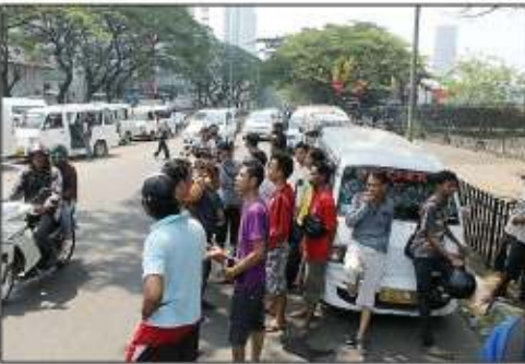
PROTES: Para sopir angkot menolak penutupan akses di perempatan jalan.