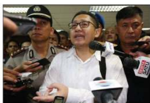
BANDING: Anas Urbaningrum usai menjalani putusan di Pengadilan Tipikor.