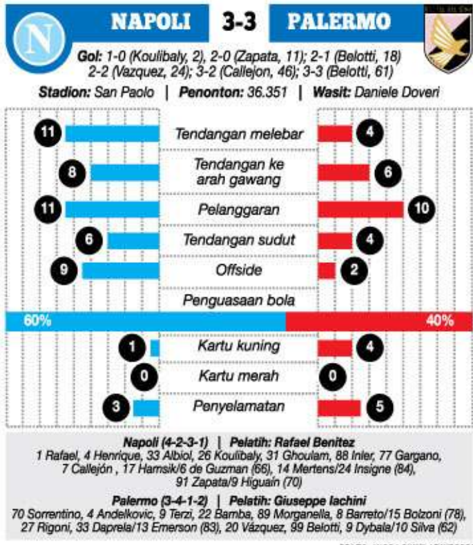
GRAPIS: ANGGA GUELMARINDOPOS

lam tiga laga beruntun di Serie A juga mulai mengancam posisi Benitez sebagai pelatih. Apalagi, Rafa juga gagal membawa Napoli menembus fase grup Liga Champions setelah dikalahkan Athletic Bilbao di babak play off. Namun pelatih asal Spanyol itu enggan berspekulasi perihal masa depan dirinya. "Apakah saya dalam resiko? Tidak. Saya belum berbicara dengan presiden dan saya tak harus berbicara kepadanya setiap lima menit hanya untuk bertanya apakah saya terancam. Ini ini telah melakukan hal bagus sebelumnya dan akan kembali melakukan itu," Eks pelatih Liverpool dan FC Internazionale itu menegaskan. Kapten Napoli Gokhan Inler mengungkapkan bahwa segenap tim mengambil tanggung jawab atas hasil imbang dari Palermo dan kegagalan meraih tiga poin dalam tiga terakhir. "Ini kesalahan kami. Kami tak bisa kebobolan lewat serangan balik seperti itu. Kami sangat butuh meningkatkan diri. Rapor dengan pelatih tidak ada masalah karena kami bekerja baik pada musim lalu," ujar Inler. (ish)