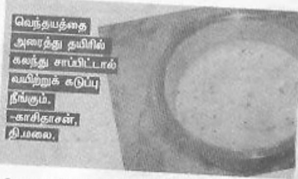
வெந்தயத்தை அரைத்து தமிழில் கலந்து சாப்பிட்டால் வயிற்றுக் கடுப்பு நீங்கும். -காரிதாசன், திமலை.